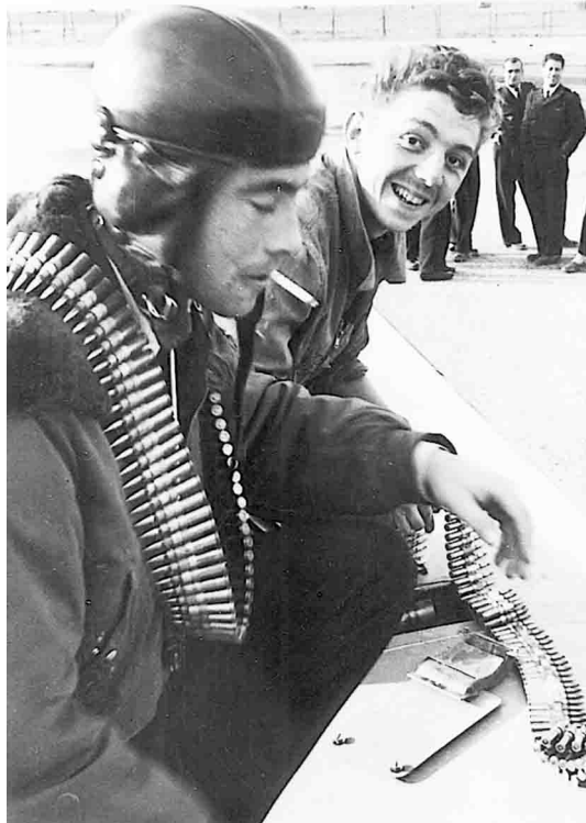
EALA 6/70 – Chargement des munitions dans l'aile d'un Morane-Saulnier 733 à Tébessa en 1956