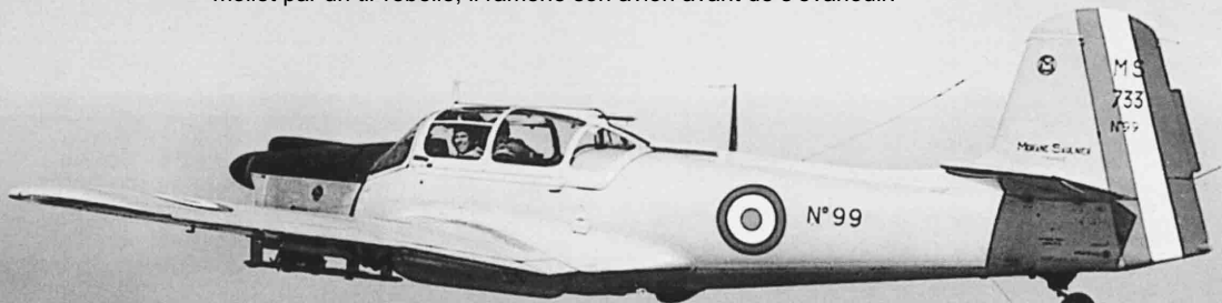
EALA 6/70 – Morane-Saulnier 733 en vol vers l'Algérie en avril 1956