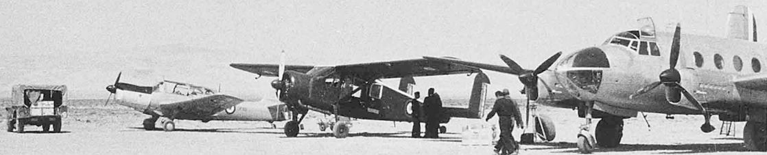
Biskra 1956 – Morane-Saulnier 733 de l'EALA 6/70, Broussard et Flamant