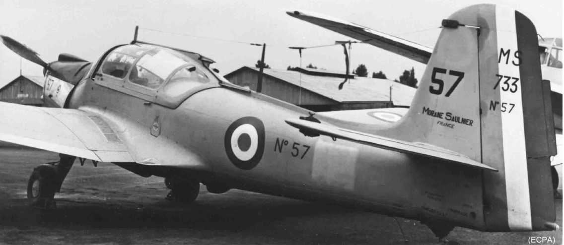
EALA 7/70 – Morane-Saulnier 733 à Oued-Hamimim