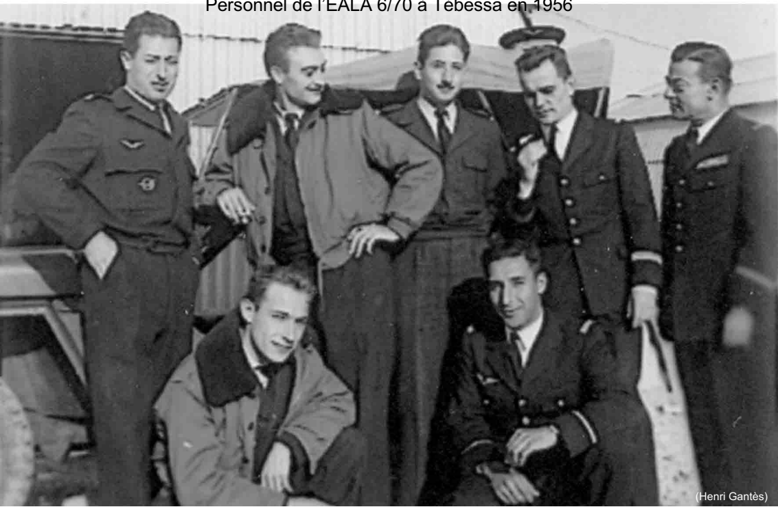
Personnel de l'EALA 6/70 à Tébessa en 1956